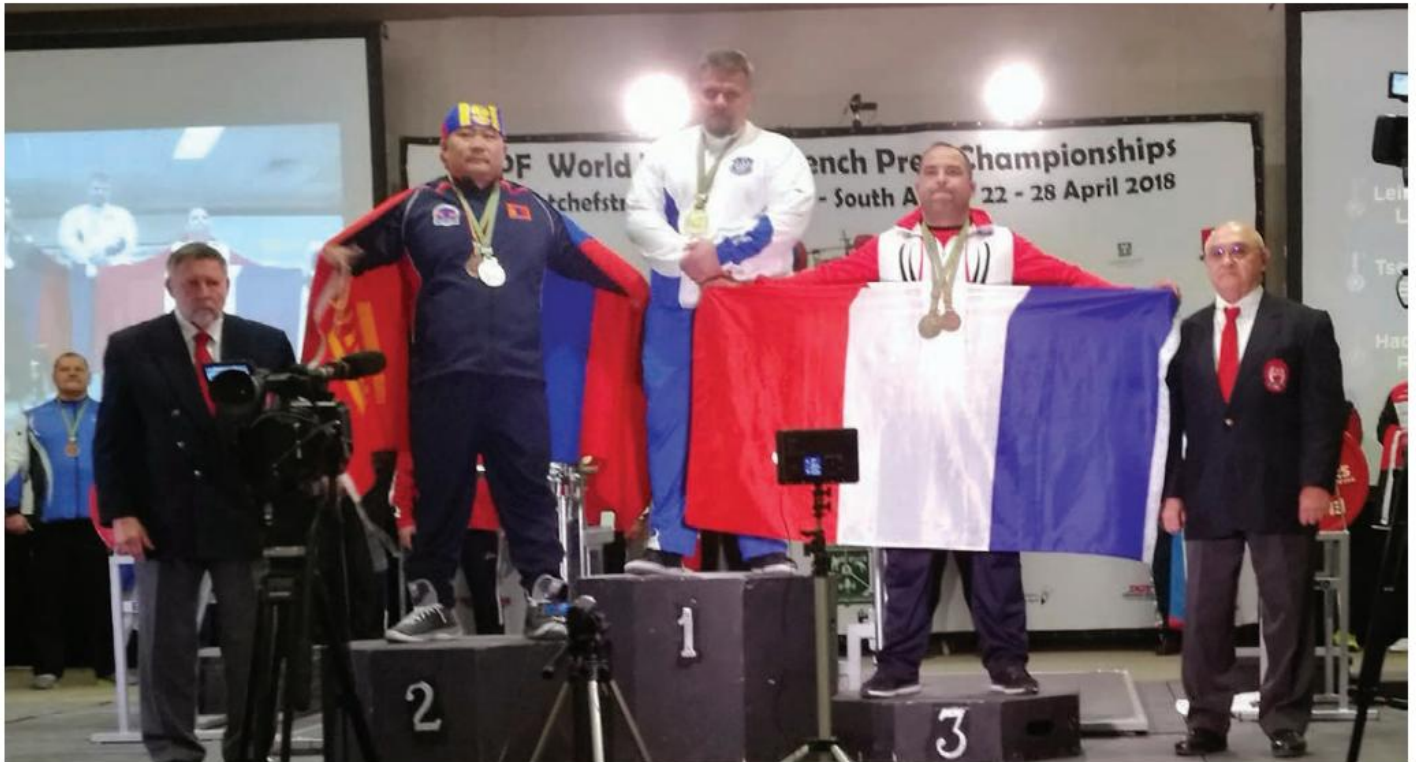
Lasse Leinonen kultamitalisti