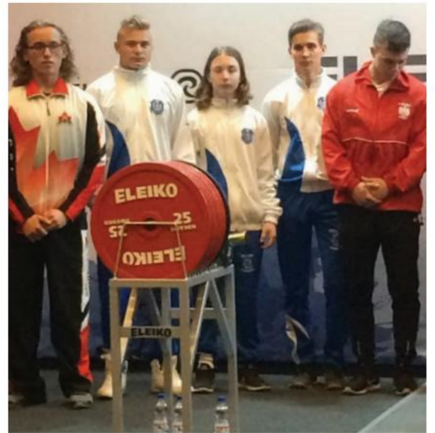
Subjuniori pojat palkintojenjaossa