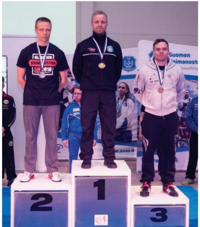
Miehet sarja 66 kg mitalikolmikko