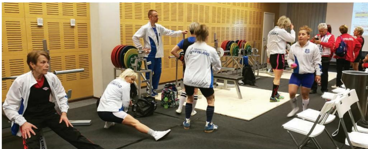
Kunnon venyttelyt ennen kisa