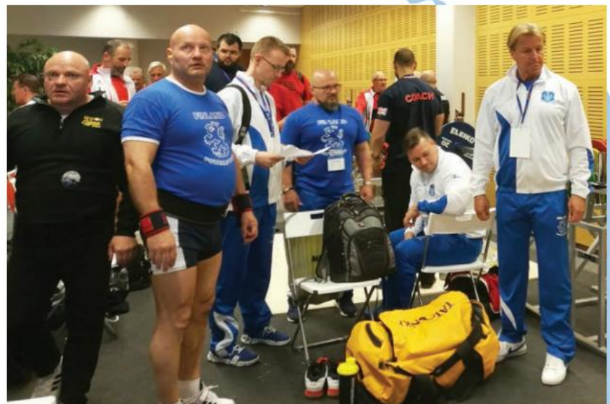
93 kg -sarjan nostajien ilmeet vakavina lämmittelyhuoneessa

Tämän kisan järjestäminen olikin melkoinen opintomatka kun aikaisempaa tietoa ei ollutkaan saatavissa Suomessa järjestetyistä arvokisoista siinä määrin missä luulin sitä olevan tarjolla. Toki kaikki asiat saa hoitumaan