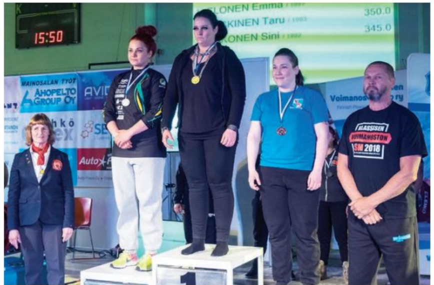
Naiset sarja 84+ kg mitalikolmikko

Ylöjärven Ryhdin voimastostausto toivottaa Voimastaja-lehden lukijoille lämmintä kesää ja menestystä treeneihin.