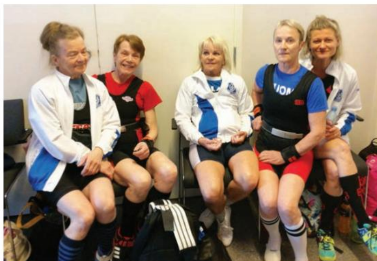
Mitalitytöt jonottavat varustetarkastukseen