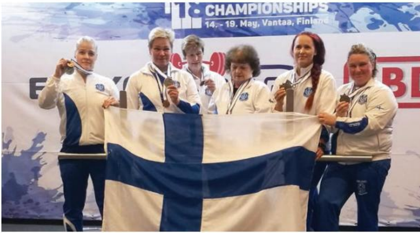
Suomi kaunottaret yhteiskuvassa