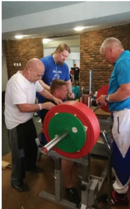
Lassen varusteiden hienosäätö meneillään

Varustepenkkipunnerruksen MM-kilpailut järjestettiin Potchefstroomissa, Etelä-Afrikassa. Suomea oli paikalla Afrikassa edustamassa neljä miespuolista mastersnostajaa ja avoimesta luokasta kaksi naista ja yksi mies. Joukko oli pieni, mutta sitäkin tehokkaampi ja mukana oli tietenkin huoltaja sekä joukkueenjohtaja.