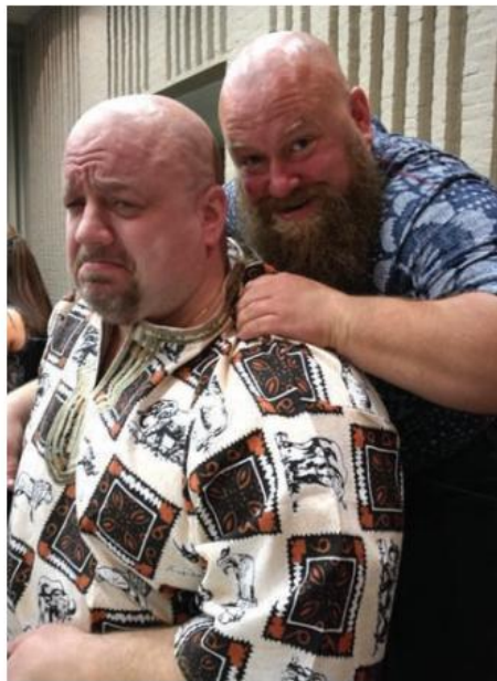
Lihashuolto pelasi banketissa naapurimaan toimesta