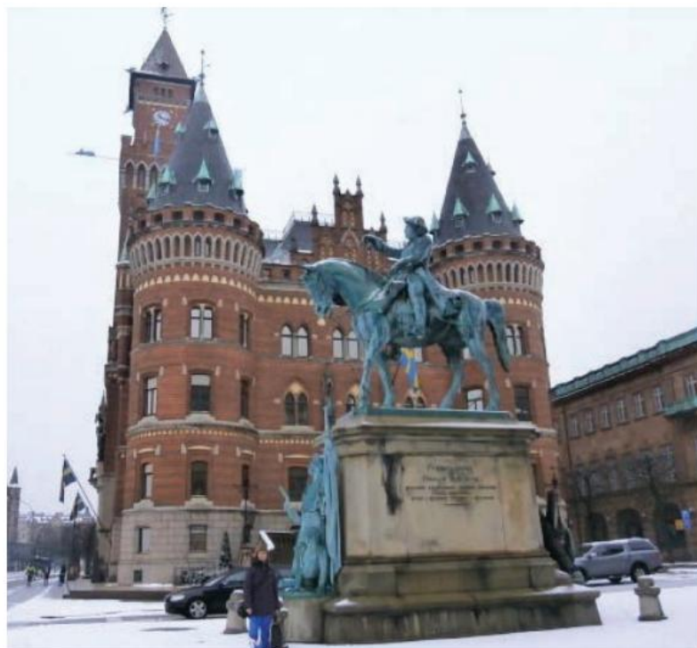
Helsingborg - mielenkiintoinen satamakaupunki Etelä-Ruotsissa