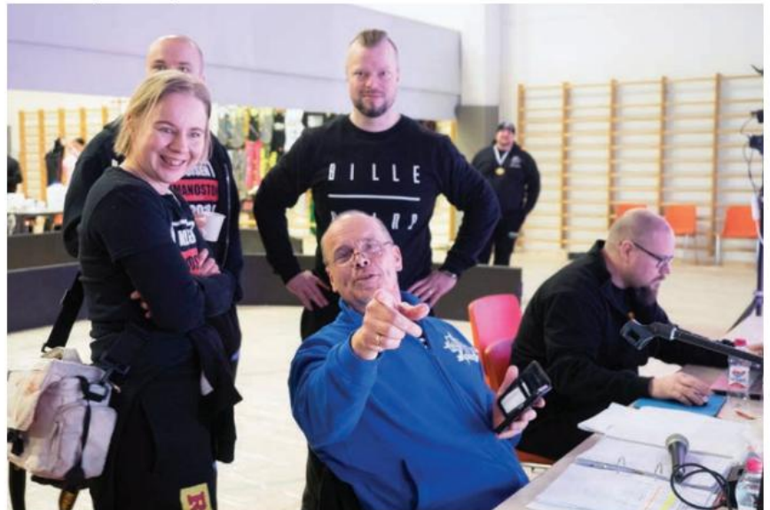
Kisat ohi - toimitsijoitakin hymyilyttää