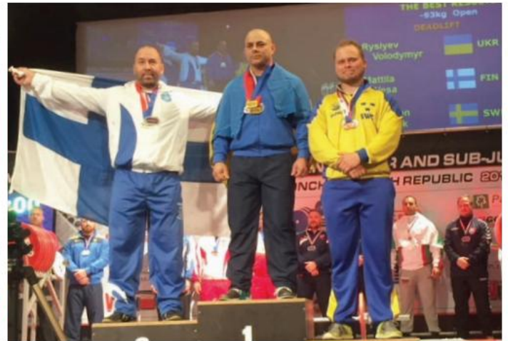
Vesalle lajihopea vedosta