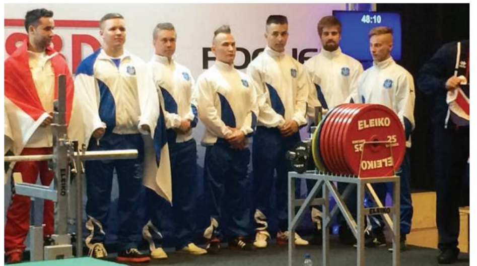
Komea rivi Suomen juniorimiehiä palkintojenjaossa