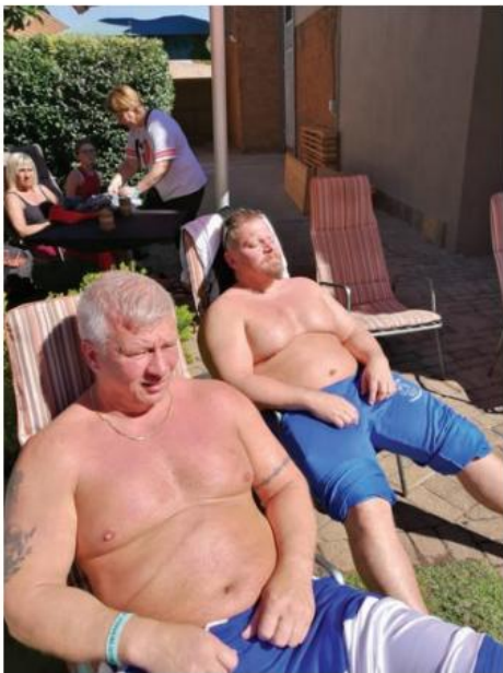
Lihasten kasvatusta auringossa