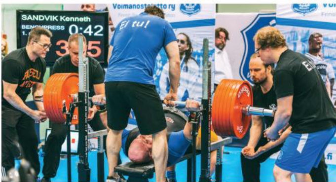
Järjestävän seuran slogan ei Kentan kohdalla toteutunu