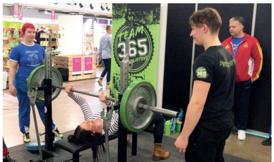
Messuväki penkkaa - naiset 40 kg

Moni näytteilleasettaja kävi sunnuntaina testaamassa omia voimatasojaan ja heistä