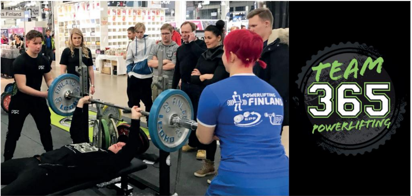
Messuväki penkkaa - miehet 65 kg